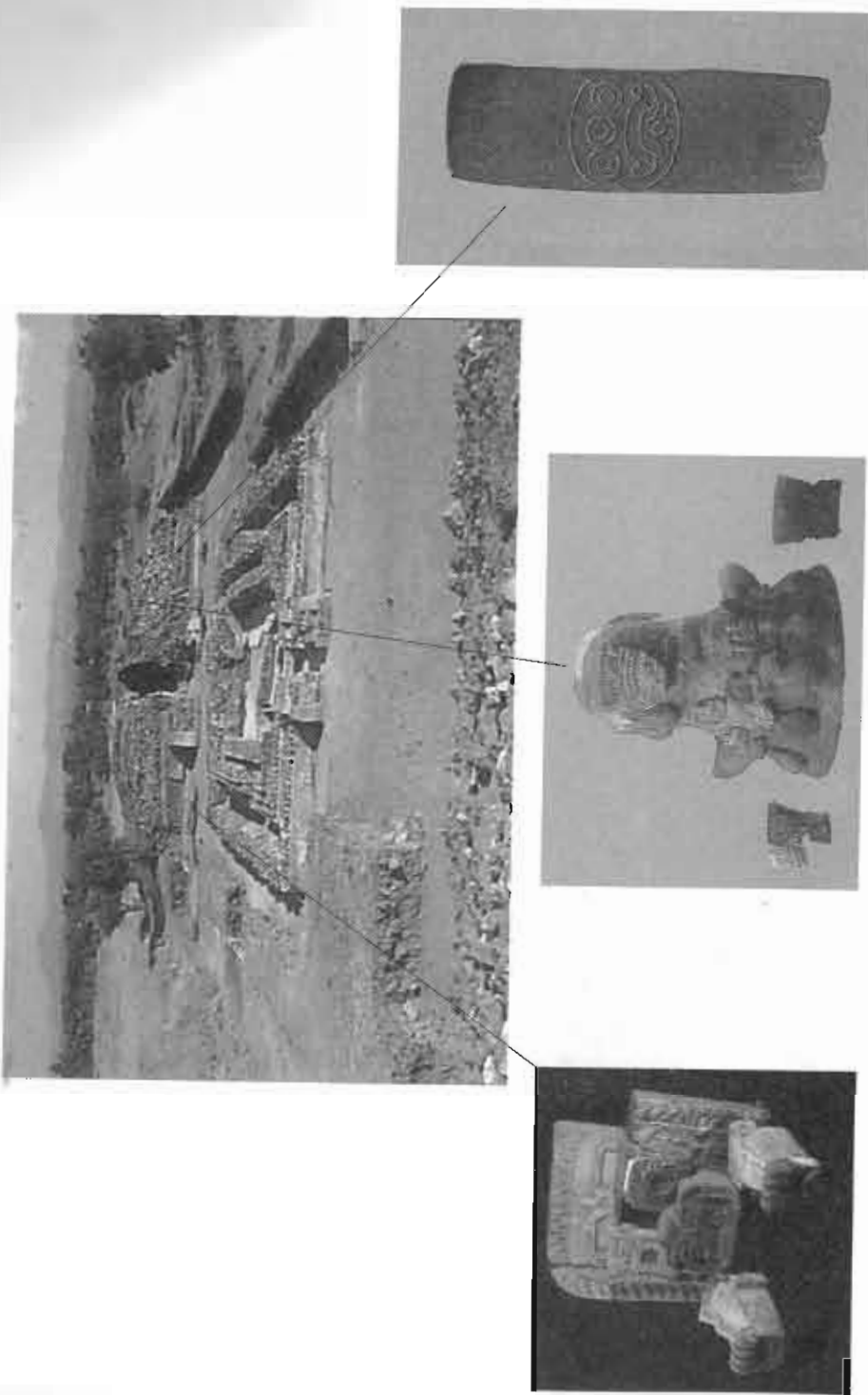
Figura 4. La Estructura 2 de Xalla y su iconografía del Dios de las Tormentas

amén que no parece ser un conjunto integrado, como lo propusieron originalmente Mathew Wallrath (1966) y otros; parecen ser más bien una serie de plazas de tres templos, tan comunes en Teotihuacan, pero integradas a otras estructuras posiblemente administrativas.