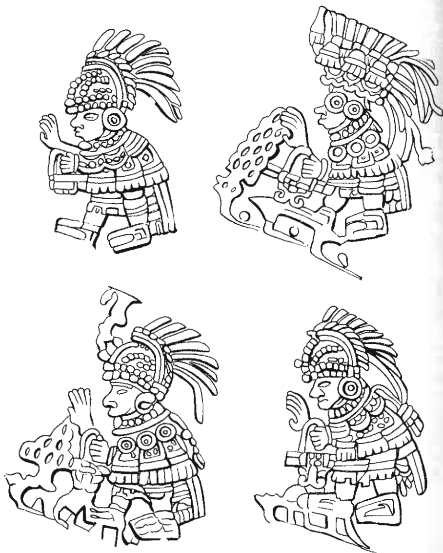
Figura 1. Cuatro personajes del famoso cuenco hallado en Las Colinas y referido por Linné, que quizás representen a los co-gobernantes

hay en el área maya. Sin embargo, si tomásemos como ejemplo los asientos del poder de tiempos de los mexicas, tanto los petates de los primeros gobernantes, como los tules o icpallis , como los cojines cubiertos de pieles de jaguar estaban hechos de materiales perecederos que no subsisten en el registro arqueológico normalmente (Marcus 1992: 195). Algunas figurillas denominadas “trono” parecen representar a bultos mortuorios sobre asientos.